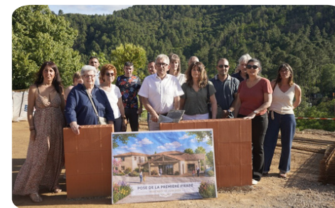
L'équipe municipale acte la sortie de terre de la résidence seniors et celle du pôle multiculturel !