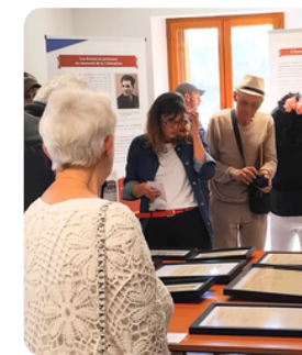
"La libération dans le Gard", une première exposition réussie