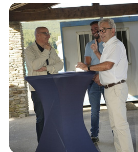
Sous l'œil avisé du vice-président du département, le partenariat entre la mairie et la SCI Le clos Sainte Anne, porteuse du projet, est bien engagé !