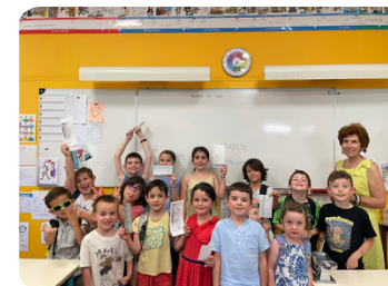
Projets culturels : gravure, musique, une école créative.