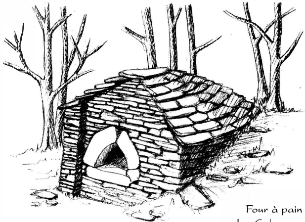
Four à pain des Cabasses

châtaigniers tandis que le mas de « l'Ardoise » indique une toiture initiale en lauzes.