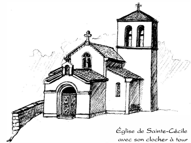
Église de Sainte-Cécile avec son clocher à tour