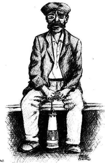
Mineur avec sa lampe