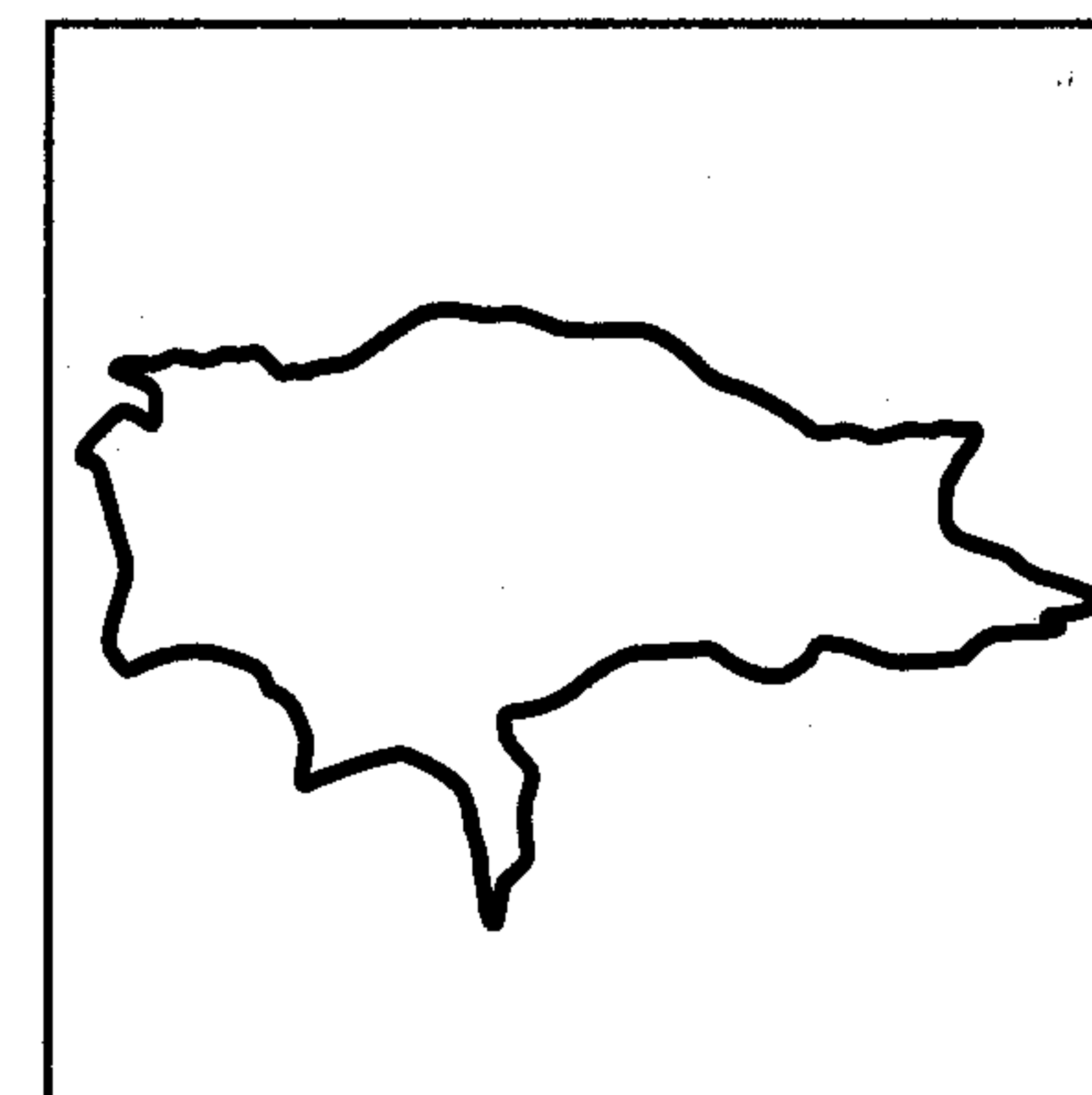
Boucle n° 13