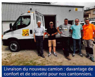
Livraison du nouveau camion : davantage de confort et de sécurité pour nos cantonniers.

> Achat d'un camion neuf de marque Iveco, la commune a bénéficié d'un fonds de concours exceptionnel d'Alès Agglomération de 15 000 €.