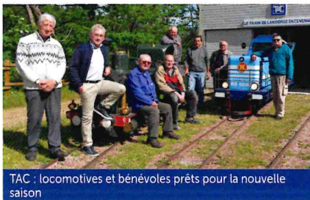
TAC : locomotives et bénévoles prêts pour la nouvelle saison