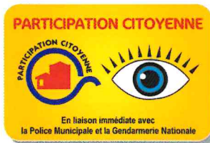
Panneaux prochainement installés aux entrées du village.

Alès Agglomération propose un pack à 20 € qui comprend l'éco-compoteur ainsi qu'un seau à biodéchets et un guide des bonnes pratiques à conserver chez soi. Les personnes intéressées peuvent s'inscrire en mairie.