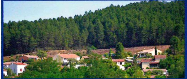
Un coupe-feu bien apprécié

Afin de permettre une mise en sécurité optimale de ses administrés, la municipalité mandate tous les deux ans «les jardins du Galeizon» pour débroussailler la ceinture du lotissement des Lumières. Le coût pour notre commune est de 6400 €.