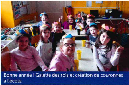
Bonne année ! Galette des rois et création de couronnes à l'école.