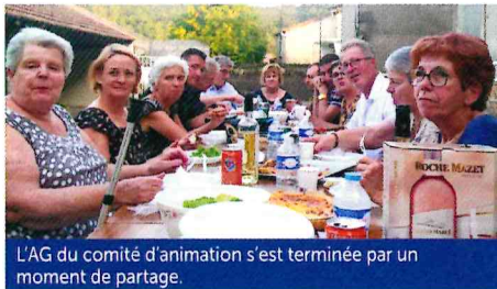
L'AG du comité d'animation s'est terminée par un moment de partage.