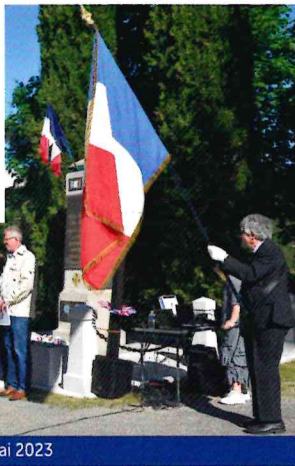
Cérémonie du 8 mai 2023