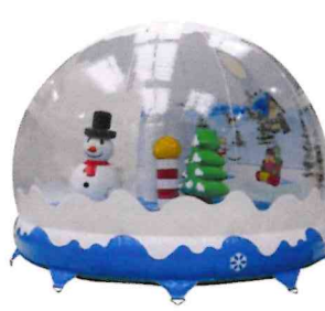
Un formidable terrain de jeux