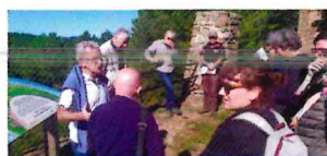
Vers un classement du site dans le patrimoine industriel historique de France?