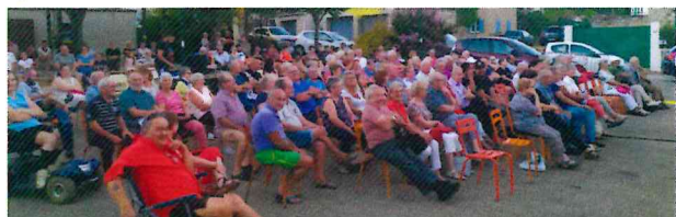
30 juillet Place de la Haute Levade, le grand Prix de la chanson toujours très attendu.