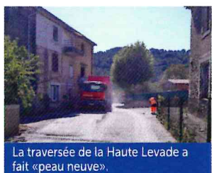
La traversée de la Haute Levade a fait «peau neuve».