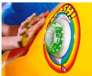
L'aérosped, un jeu interactif dynamique et sonore, venez jouer !

Dès 13h30 le dimanche 18 décembre place de la Haute Levade, le comité d'animations a sélectionné des activités pour un après-midi récréatif exceptionnel : structure gonflable, jeux en bois et aérosped. Jeu calme ou sportif ? Jeu stratégique ou d'habileté ? Chacun trouvera son plaisir pour passer un bon moment entouré des siens toutes générations confondues : le véritable esprit de Noël.