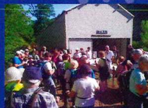
La centaine de randonneurs a apprécié la pause café offerte par notre municipalité.