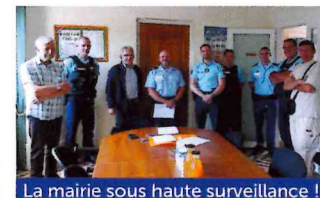
La mairie sous haute surveillance !