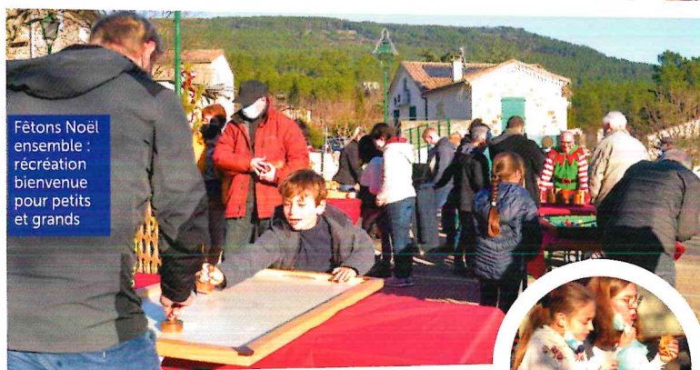
Fêtons Noël ensemble : récréation bienvenue pour petits et grands