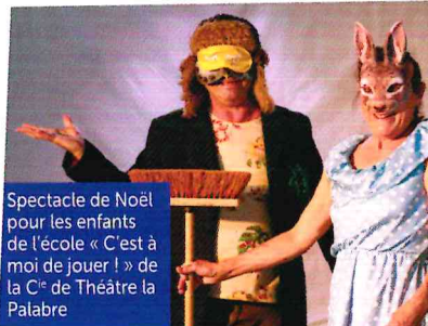
Spectacle de Noël pour les enfants de l'école « C'est à moi de jouer ! » de la C o de Théâtre la Palabre