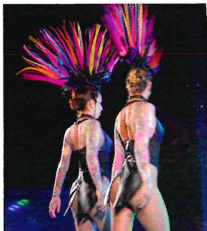
French cancan haut en couleur pour le final du grand prix de la chanson