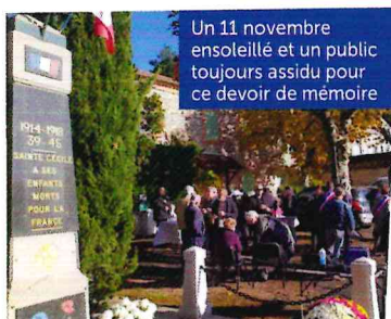
Un 11 novembre ensoleillé et un public toujours assidu pour ce devoir de mémoire