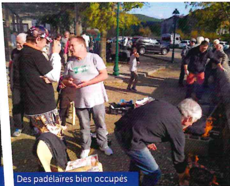
Des padélaïres bien occupés