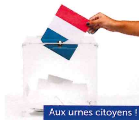
Aux urnes citoyens !

En cas de doute sur des faits inhabituels, il a été rappelé à nos administrés d'appeler le 17 pour améliorer la réactivité des forces de l'ordre.