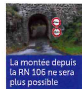
La montée depuis la RN 106 ne sera plus possible

• Une sortie sécurisée : la route communale sous le pont des Gaspardes sera bientôt en sens unique.