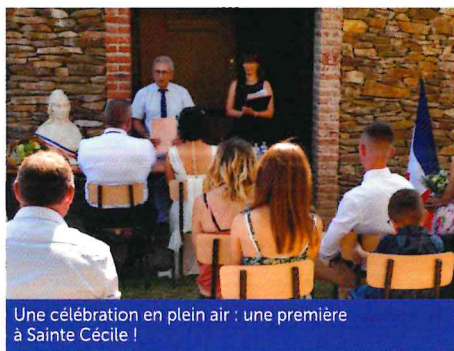
Une célébration en plein air : une première à Sainte Cécile !

Quatre mariages républicains ont été célébrés, dont un à l'extérieur... nécessitant le déplacement de notre Marianne et du drapeau tricolore, deux symboles forts de la république :