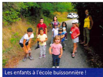
Les enfants à l'école buissonnière !