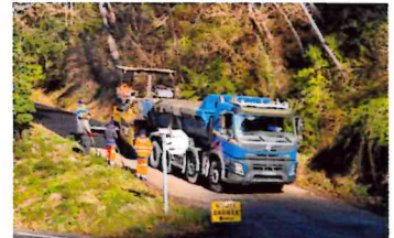
La montée des Cauvines, sous le village

- L'entreprise JOUVERT , sur un linéaire total de 1.7km de goudronnage en enrobé. Ils concernent trois secteurs :