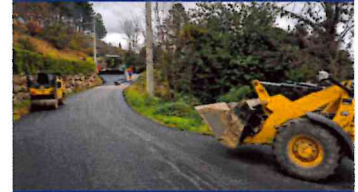
La route des terrasses du Cazet et son impasse attenante

Sont également concernés dans cette tranche de travaux, la réfection d'un passage busé et la reconstruction d'un mur au quartier de Casevilleille.