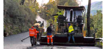
Le chemin de Mignard, via les Thibauds