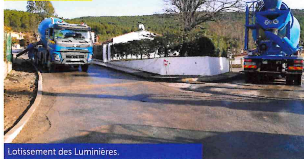
Lotissement des Lumières.