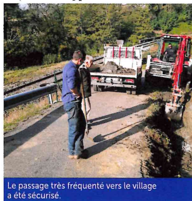
Le passage très fréquenté vers le village a été sécurisé.

• Pour les conducteurs, la descente du village suscitait toujours de l'appréhension au croisement d'un véhicule à